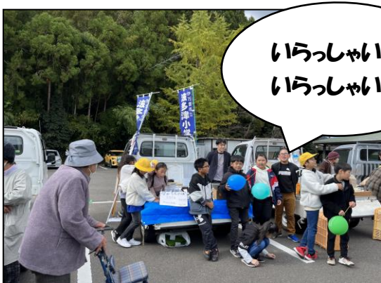
【4年生: 完売目指した呼び込みの様子】