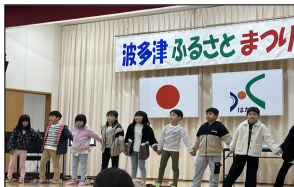
【3年生: 元気な合唱とリコーダー演奏】